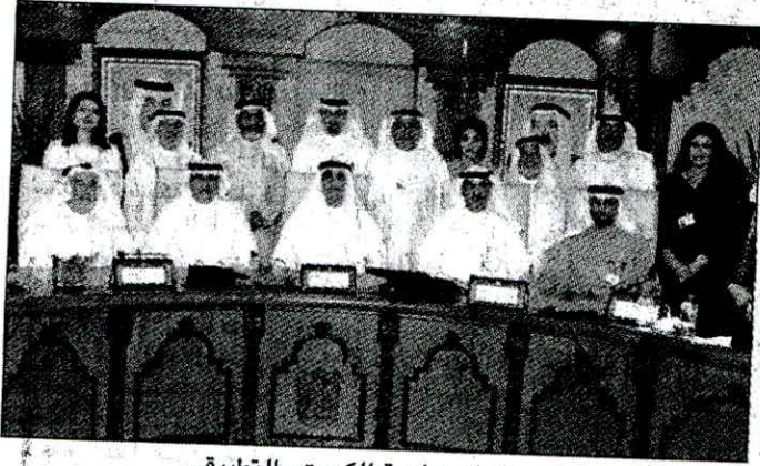
• مسؤولو جامعة الكويت والتطبيقي