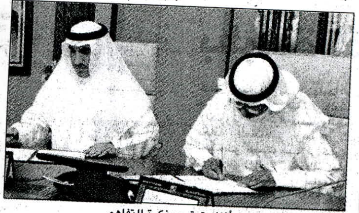
• أثناء توقيع مذكرة التفاهم

المختبرات العلمية، مبينا أنه من خلال هذه الاتفاقية سيتم توحيد أهداف ولوائح العمل المشتركة، والاتفاق على صياغة التعاون وبرمجته بصورة تطبيقية عملية تحفظ حقوق المؤسستين وتزيد من نسبة التعاون الموحد المشترك. يذكر أن هذه الاتفاقية تهدف إلى تبادل المؤسستين للخبرات العلمية والبحثية فيما يخص قضايا الدولة التنموية عن طريق التعاون بتنظيم المؤتمرات والندوات العلمية وورش العمل الفنية وإنتاج إصدارات علمية مشتركة، كما تدعم تبادل الزيارات والوفود العلمية وتكوين فرق عمل لتدريب الباحثين والفنيين، والاستفادة من مخرجات الاختراعات العلمية، وإثراء مراكز المعلومات والمكتبات المتوافرة بين المؤسستين.